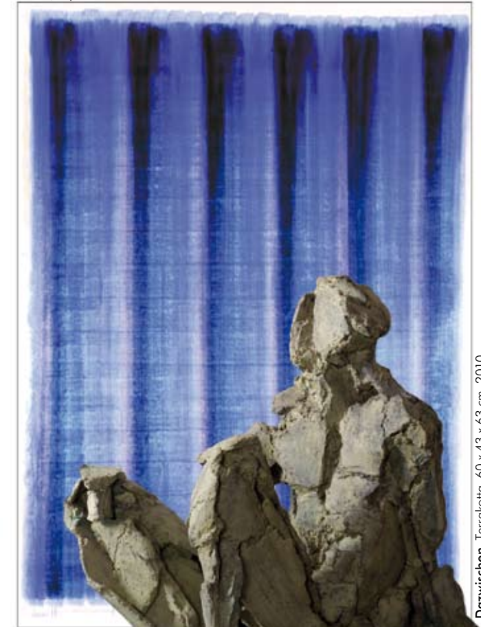
Dazwischen, Terrakotta, 60 x 43 x 63 cm, 2010