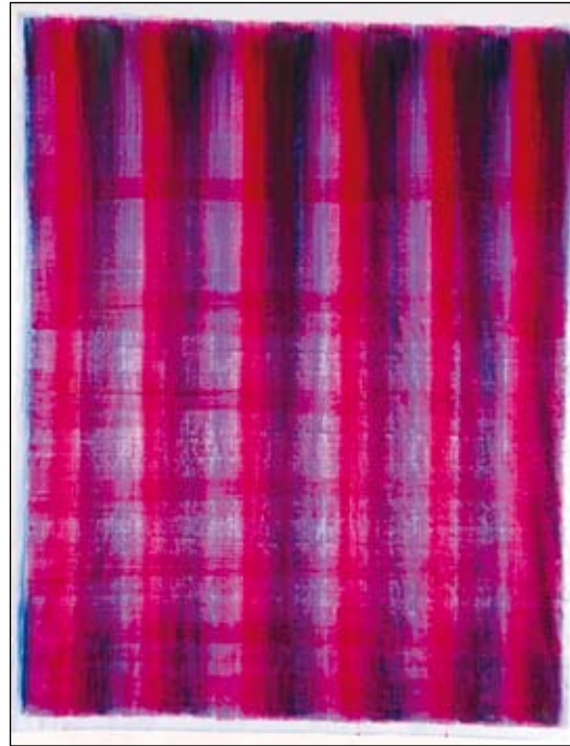
o.T., Aquarelle, ca. 200 x 150 cm, 2008