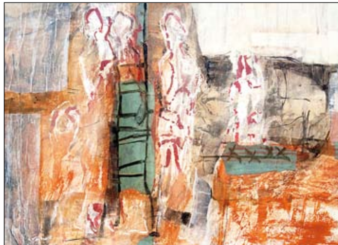
Suche, Mischtechnik auf Karton, 53 x 73 cm, 2013

Menschen interessieren mich, welche, die suchen, einander begegnen, unterwegs sind. Ich baue aus groben Formen, was blieb von Erlebtem, durchaus persönlich und doch universell. Harte Kanten und weiche Massen gehen ineinander über. Mitunter erzeugt die Andeutung einer Silhouette den Eindruck von Bewegung. Farbige Schichten verbinden oder differenzieren die geprägten Formen der Terrakotten. Auch auf dem Papier finde ich Farbe und Linien, ergänze, was mir zwingend erscheint. Immer wieder Menschenbilder.