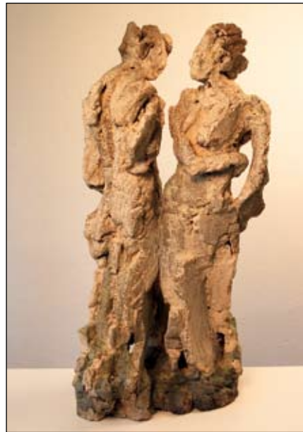
Paar, Terrakotta, 71 x 35 x 35 cm, 2013