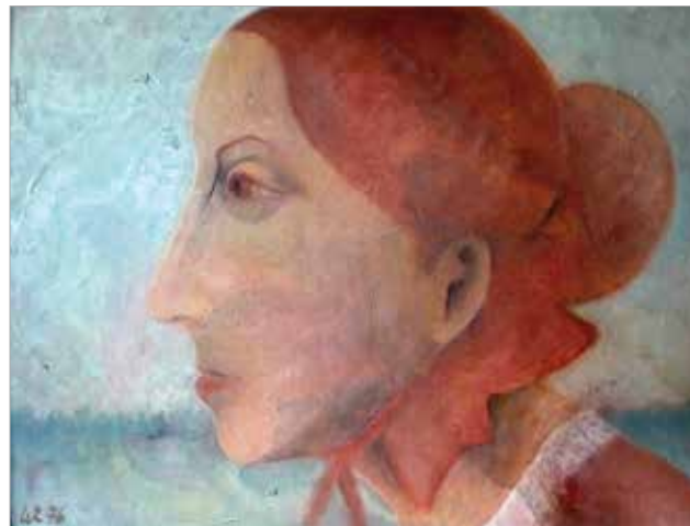
Zum Gedenken an Paula Modersohn-Becker. Öl auf Hartfaser, 28 x 35,5 cm, um 1975