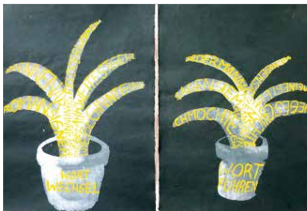
SprachPflanze . Aquarell auf vietnamesischem Papier, 50 x 37 cm, 2005