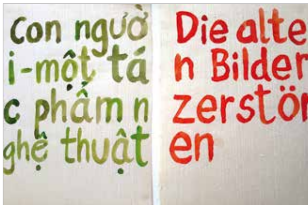
SprachRaum . Detail, Handzeichnung, Aquarell auf vietnamesischem Papier, 69 x 48 cm, 2005