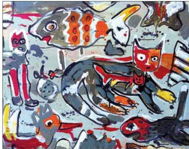
Graue Katze. Acryl auf Papier, 50 x 70 cm, 2014