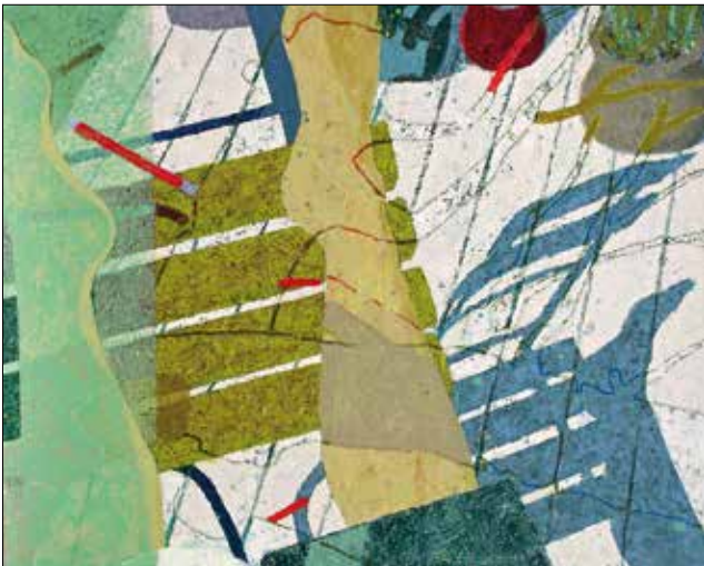
Reconstruction. Öl auf Leinwand, 60 x 70 cm, o. J.

Arbeiten in New Hall Women's Art Collection, Cambridge; Chelsea & Westminster Hospital, London; Kroll international, London, sowie in privaten Sammlungen