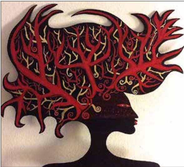
Paradiesvogel Koralle (Detail), finnische Holzpappe, bemalt und lasiert, 2014