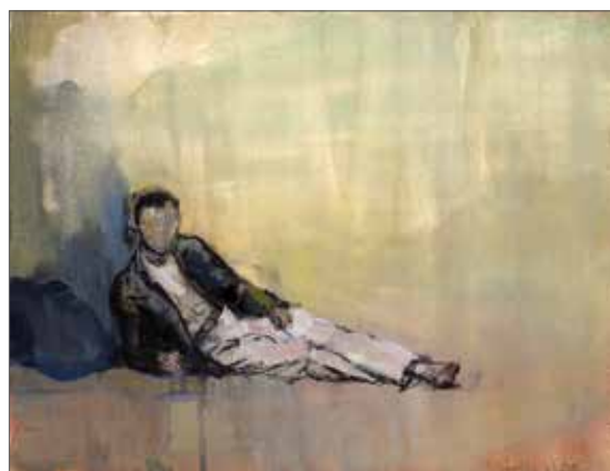
»o. T. (Der Trommler/Zapust)«, Gouache auf Papier, 30 x 40 cm, 2015