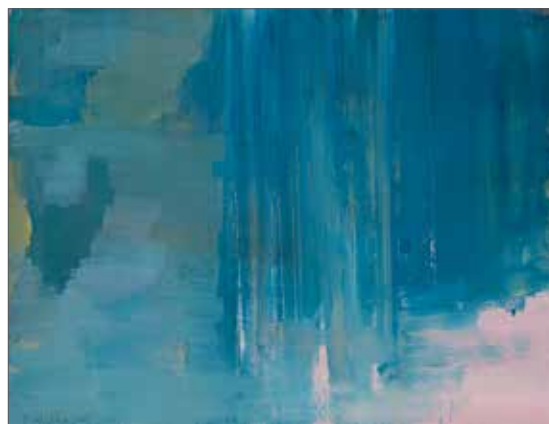
»o.T.«, Gouache auf Papier 30 x 40 cm, 2015