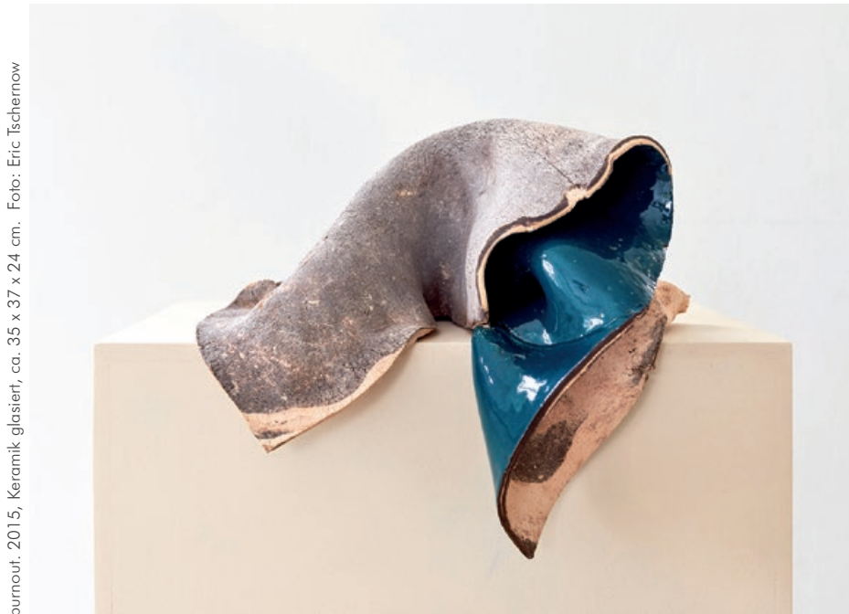
burnout, 2015, Keramik glasiert, ca. 35 x 37 x 24 cm.

verschliffen oder grob gekörnt. So scheint das Spiel der Möglichkeiten ein wesentlicher Antrieb ihrer Arbeitsweisen zu sein, und doch kehren die Künstlerinnen immer wieder zum Ursprung zurück - zur Grundform und Ausgangsmaterie.