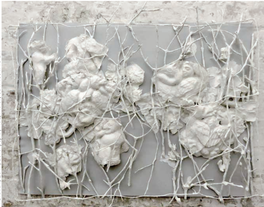
im Dickicht, 2017, Büttenpapier, Holz, Metall, 85 x 105 x 15 cm

Als bevorzugte Technik nutze ich das archäologische Verfahren der Papierabformung. Objekte der Kunst- und Kulturgeschichte, die sich am Rande unserer Wahrnehmung befinden, möchte ich auf diese Weise wieder und neu sichtbar machen. Die Papierhaut präsentiert das abgeformte Original und als leere Hülle zugleich dessen Abwesenheit. Ich arbeite daran, diese Abformungen in meinen Installationen unterschiedlich zu formieren, zu bündeln, zu konzentrieren, um ihnen neue Qualitäten und Wirkungen abzugewinnen. Astrid Weichelt