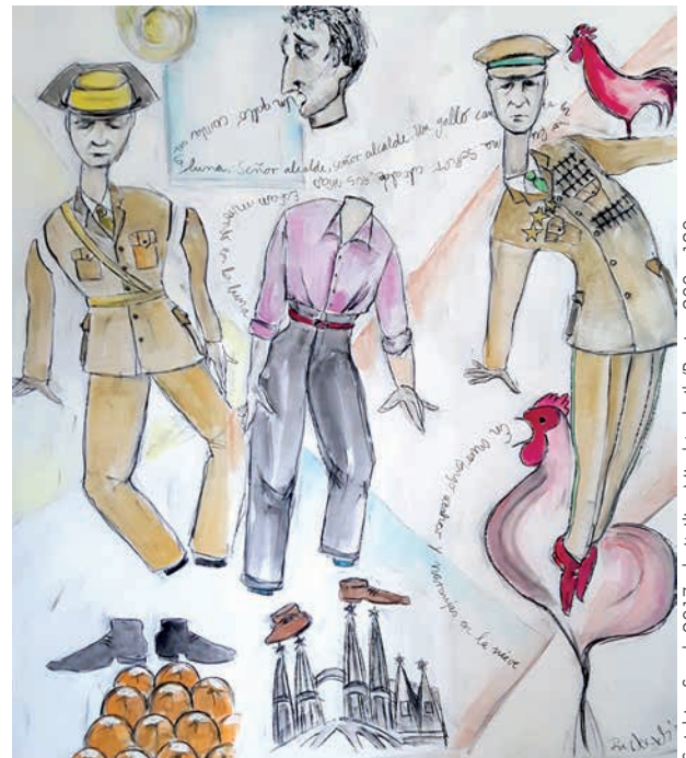
Spiel im Sand, 2017, dreiteilig, Mischtechnik/Papier, 200 x 120 cm

Aus der Theaterarbeit kommend, eröffnen mir das Zeichnen, das Drucken sowie das Gestalten textiler Objekte zusätzliche Möglichkeiten, Menschen zu beschreiben und darzustellen. Diese freien Arbeiten bilden den Ursprung für die charakteristische Erfassung einer Figur. Im Ergebnis wird jedes einzelne Blatt Spiegel einer künstlerischen Suche, die mit meiner ersten Empfindung zu einer Person beginnt. Die Basis für meine Inspiration ist immer die Beobachtung. Veränderungen werden wahrgenommen und kreativ verarbeitet. Pia Wessels