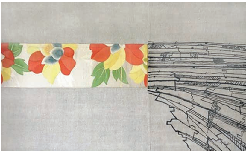
Blütenergüsse, 2014, japanische Seide, Tusche/Leinen, 60 x 100 cm

Lebt in Berlin. 1966 Abschluss als Mode-Designerin, Fachhochschule Hamburg. 1977-88 Studium Bühnenkostüm, Hochschule der Künste Berlin, Meisterschülerin bei Martin Rupprecht. 1979-84 Aufenthalte in Japan, nach 1990 in den USA. 1988-2012 Theater-, Opern-, Tanz-, u.a. Projekte in Japan, Europa, USA. Seit 1993 Lehrtätigkeit: North Carolina School of the Arts/USA; Hochschule für Bildende Künste Dresden; Institut für Theater, Musiktheater und Film Hamburg; Oberstufenzentrum Berlin-Charlottenburg (Maskenbild).